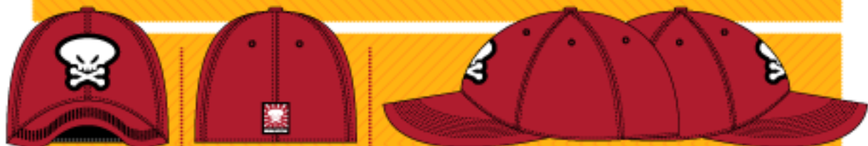
ROJO / RED [RED]

Gorra de 6 paneles original FLEXFIT® de ajuste flexible. Disponible en 2 tallas: S-M y L-XL para mayor ajuste y confort. Con bordado a 2 colores en la parte frontal y etiqueta tejida en la parte trasera. Composición del producto: 98% Algodón y 2% Spandex. Disponible en color Rojo [RED].